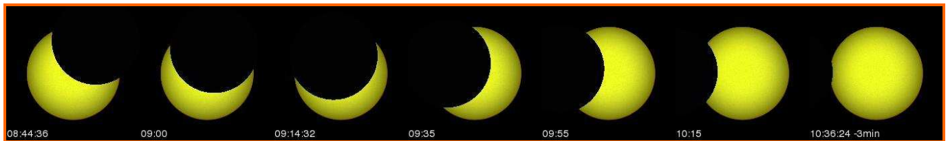
DÉROULEMENT DE L'ÉCLIPSE À BRUXELLES / BRUSSEL – 68,5%

➤ Ce document est la propriété de SODAP-SOBOMEX et protégé par les lois internationales sur le droit d'auteur et de la protection de la propriété intellectuelle.