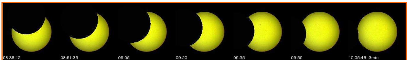
WHAT YOU WILL SEE OF THE ECLIPSE IN MADRID – 46.8%

> This document is the property of SODAP-SOBOMEX and protected by the international authors laws and the protection of the intellectual property.